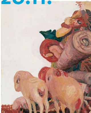
Foto: Georg Baselitz. Sommermorgen, 1964, MKM Museum Küppersmühle für Moderne Kunst, Duisburg, Sammlung Ströher © Georg Baselitz 2019