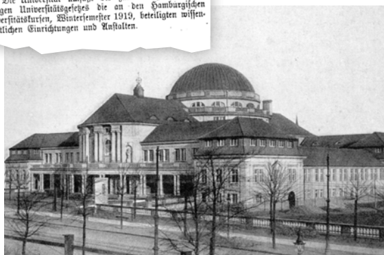
Auszug aus dem Bürgerschaftsprotokoll/ Das historische Hauptgebäude der Universität Hamburg