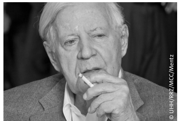
Alumnus Helmut und seine Frau Loki Schmidt waren der Universität stets eng verbunden

Unsere Alumni sind unser Aushängeschild: Viele von ihnen kommen von außerhalb nach Hamburg und bleiben nach ihrem Abschluss hier. Sie sind nicht nur ein Innovations- und Wirtschaftsfaktor für den Standort, sondern auch ein Garant für eine wachsende und weltoffene Stadt. Und manche sind bereits Hanseaten und stehen für unser Motto: Unsere Stadt – unsere Uni!