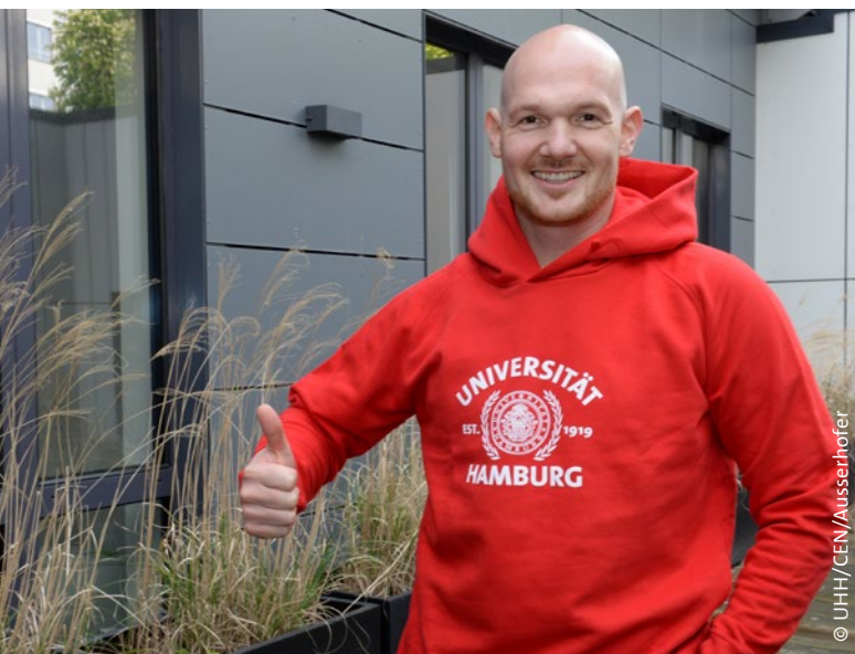
Dr. Alexander Gerst für die Mission Universität Hamburg